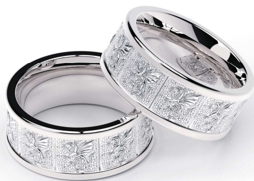
By: Manuel Angel Piñero Solsona