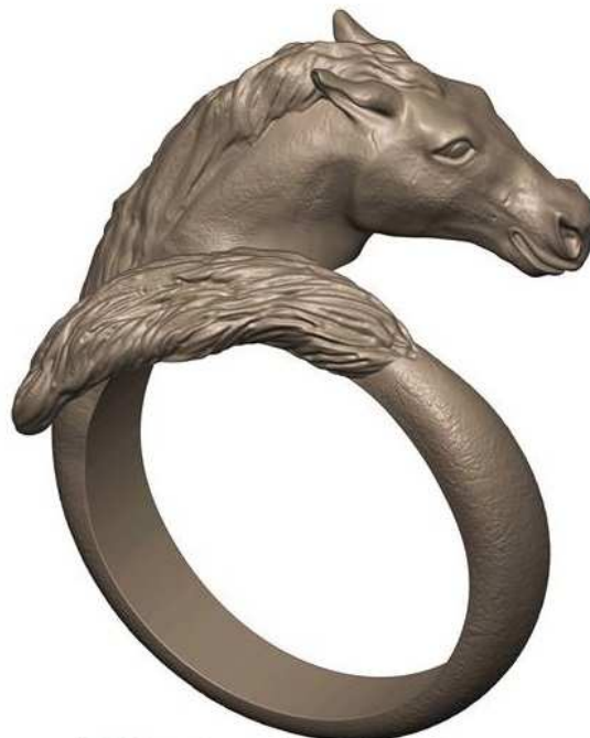
by Manuel Ángel Piñeiro Solsona